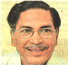
വി. മധ്യസ്വദനൻ നായർ

മണ്ണും വെള്ളവും ആകാശവും അന്യമായ നഗരത്തിൽ കഴിയുന്ന അച്ഛനും മകളുമാണ് 'അച്ഛൻ പിറന്ന വീട്' എന്ന കവിതയിലെ പ്രമേയം. ബ്രിട്ടീഷ് കോളനിവാഴ്ചയ്ക്കിടയിലെ ഇന്ത്യൻ അനുഭവങ്ങളുടെ സു