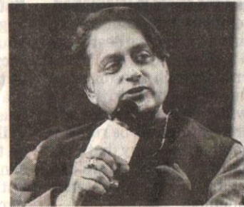
Congress leader Shashi Tharoor