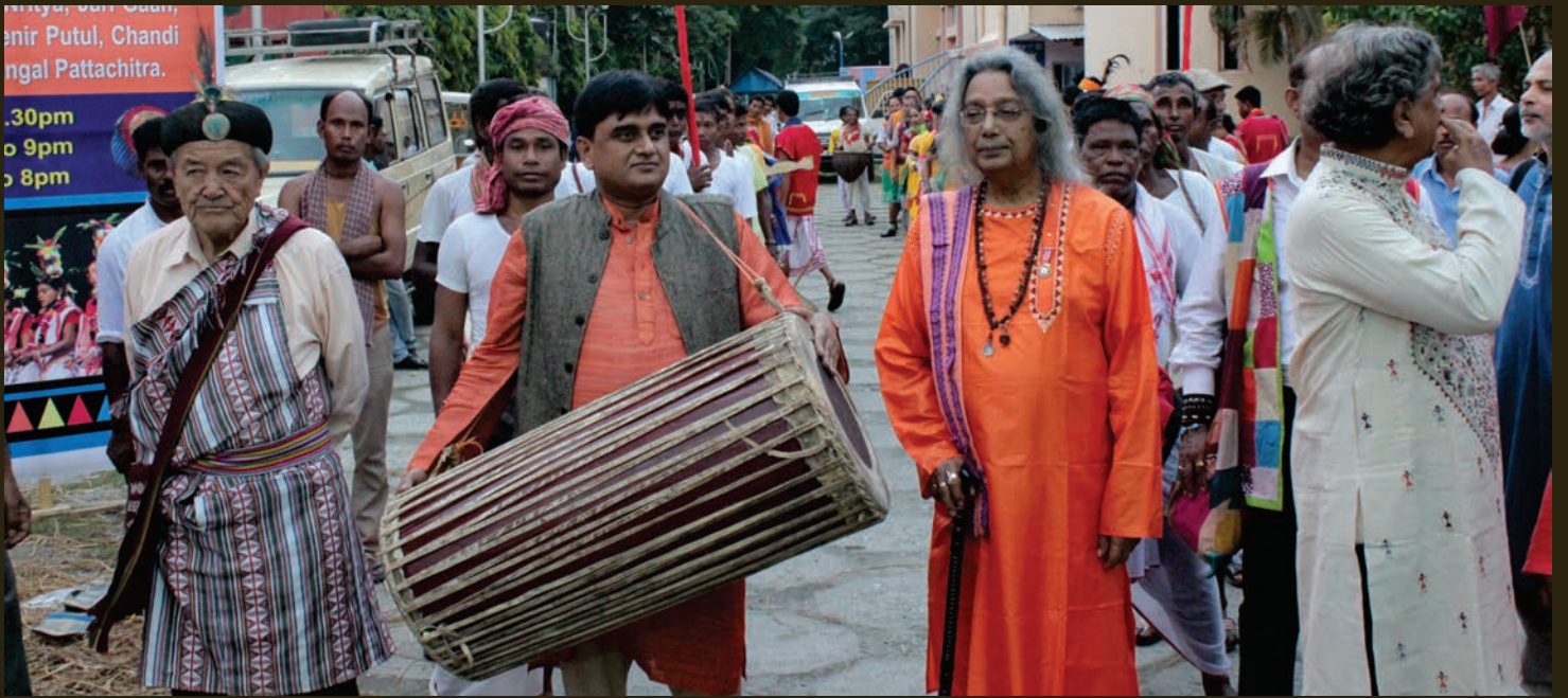
ADI VIMB, JALPAIGURI