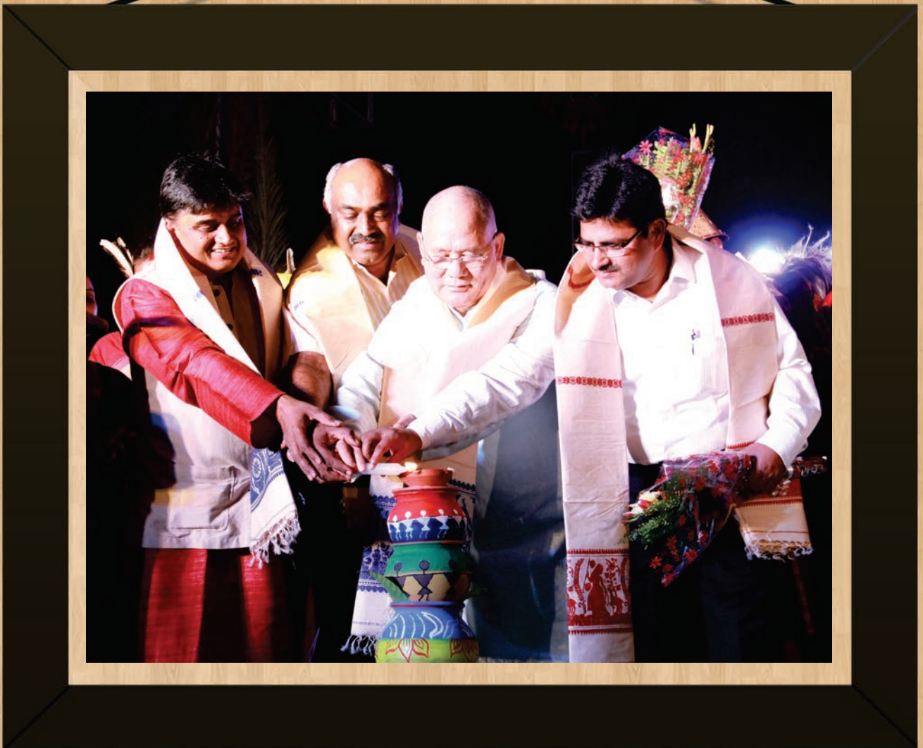
ADI VIMB, JHARKHAND