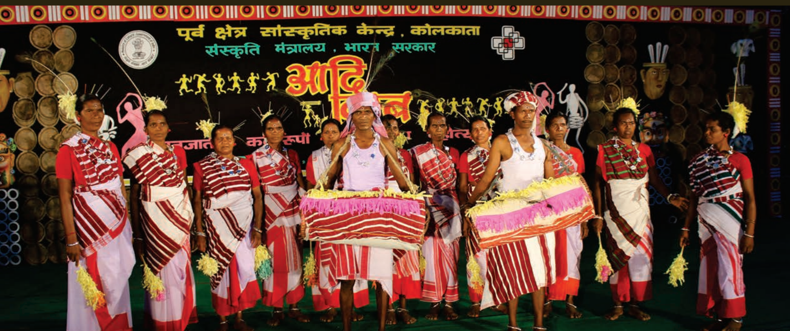
ADI VIMB, JHARKHAND