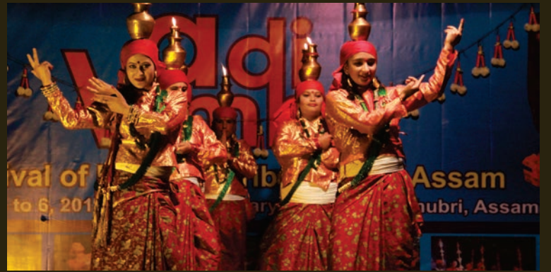
ADI VIMB, ASSAM