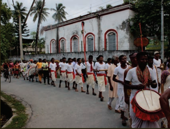
ADI VIMB, JALPAIGURI